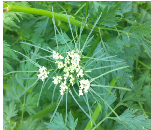
Blommande vildpersilja, med dess nedåtriktade, stora svepen.

Vildpersilja har länge betraktats som giftig för människor (Nelson et al., 2020), men även för djur. Statens Veterinärmedicinska Anstalt (SVA) uppger att vildpersilja innehåller bland annat coniin-liknande piperidinalkaloid (coniin finns i den giftiga växten odört ) samt den narkotiskt verkande alkaloiden cynapin. Hästar som har ätit mer än 500 gram färsk vildpersilja uppges ha förgiftats (SVA, 2026), men växten anses även vara giftig för nötkreatur, getter och grisar. I Italien finns dokumenterat 23 förgift-