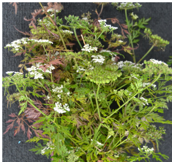
Vildpersilja med frö.

en osäkerhet om det kan finnas andra substanser än alkaloider i vildpersilja som gör att den även fortsättningsvis ska klassas som giftig.