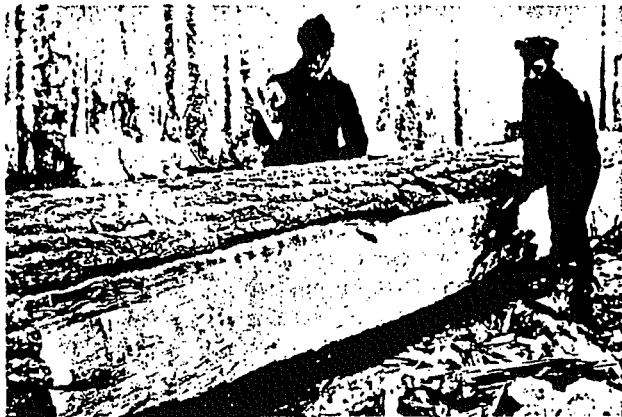
Ont. Ministry of Natural Resources

Huggarlag letade själva upp lämpliga avverkningsprojekt och "med hjälp av oxar, yxor, fläsk, en säck mjöl och en tunna rom" levererades virket kanthugget efter de stora vattendragen för vidare export. I början av denna intensiva avverkningsperiod gjorde både engels- och fransmännen försök att märka de mest eftersökta virkessortimenten (ex mastvirke) på rot i skogen. Detta negligerades dock helt av huggarna som högg där det föll dem in. Inte sällan förekom kontroverser eller regelrätta guerillakrig mellan huggarlag och nybyggare. Detta slutade dock med att licensierade områden infördes av staten. Huggarna tvingades då hålla sig inom ett visst område för avverkning och nybyggare erhöll eget land att bruka.