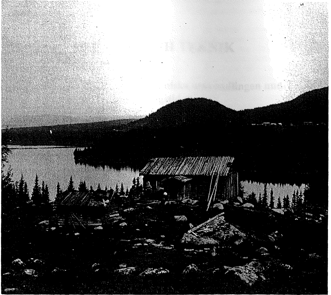
Finskt rökpörte med gårdsbyggnader i Sverige.