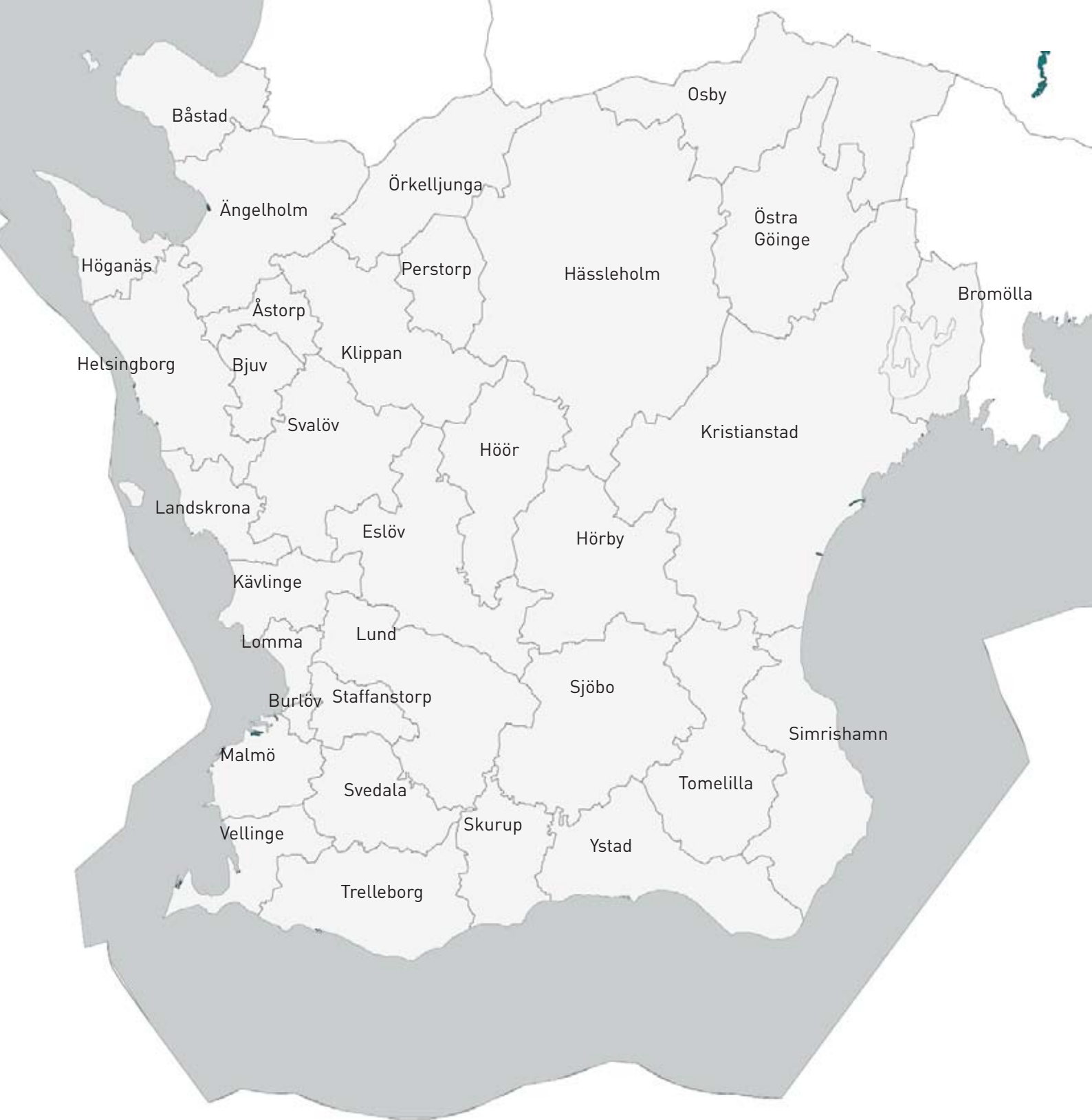
Karta över Skånes kommuner