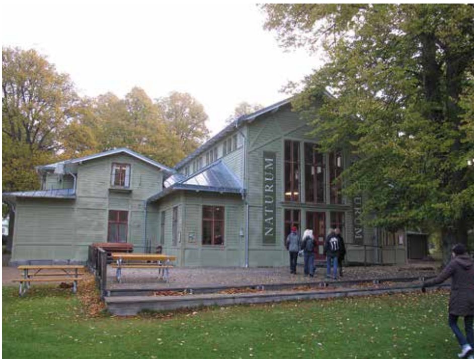
Naturum Blekinge.