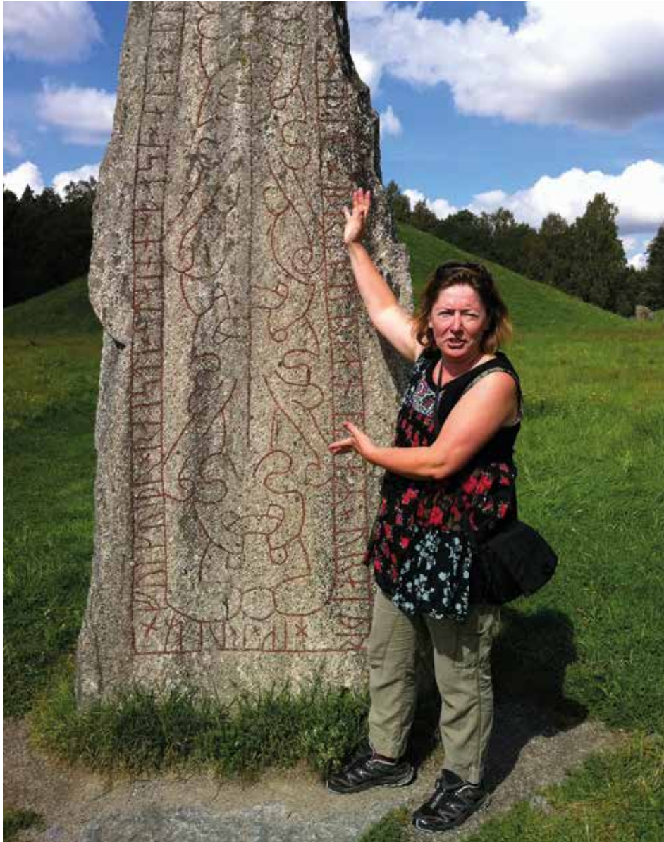
Arkeologiska guidningar är exempel på när natur- och kulturvägledning kan integreras.

landskapet. Studier har gjorts inom forskningsfält som sociologi (t ex Samuelsson, 2008), etnologi (t ex Saltzman, 2001; Daun, 2009), kulturgeografi (t ex Mels, 2002), landskapsplanering (t ex Olwig, 2001 27 ; 2005), human-ekologi och miljöhistoria (t ex Sörlin, 1991) men även filosofi/etik (t ex Uddenberg,