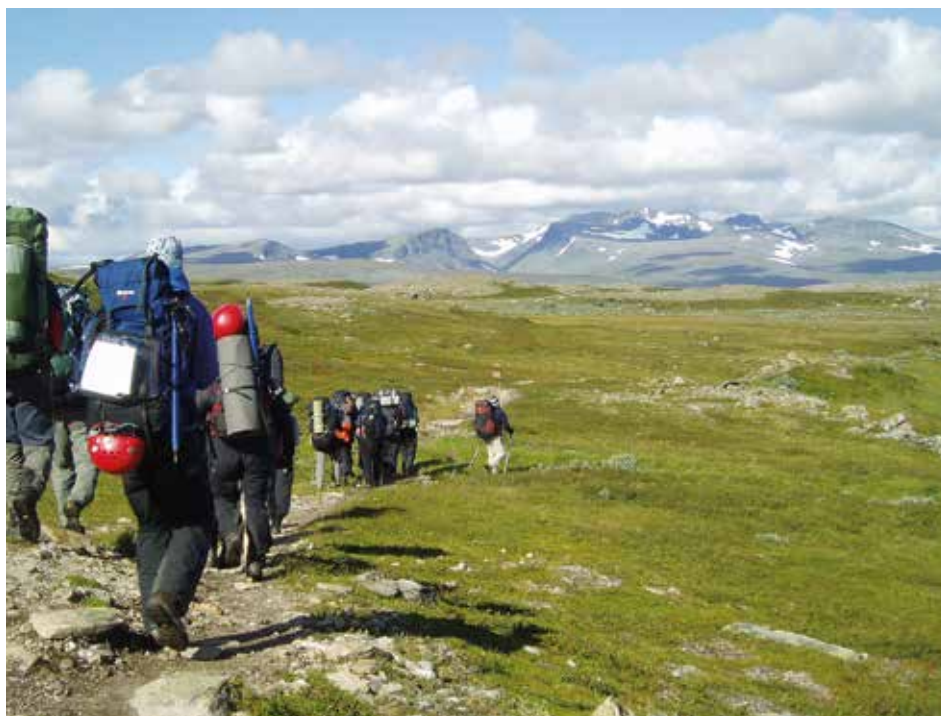
Fjällvandring i Jämtland.

Friluftslivsforskningen är ett brett fält och dess frågeställningar av många slag. Jag kommer att nämna något om bland annat definitioner av friluftsliv och naturturism, besökarstudier och tillgänglighet, eftersom detta på olika sätt kan anknytas till naturvägledning.