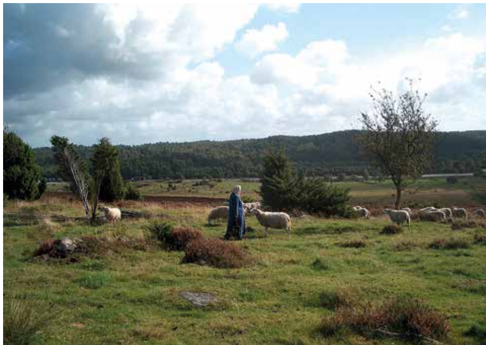
Naturmöte i kulturlandskapet.

Platskänsla är något som angränsar till natursyn. Soini et al. , (2012) har gjort en finsk studie om platskänsla vid den urbana-rurala gränzonen, och landskapet som kuliss eller boplats. En jämförelse av platskänsla hos turister och lokalbefolkning i en nationalpark i Norge presenteras av Kaltenborn & Williams (2002). Diskussionen om dikotomin natur-kultur, samt platskänsla fortsätter lite senare i avsnittet om natursyn.