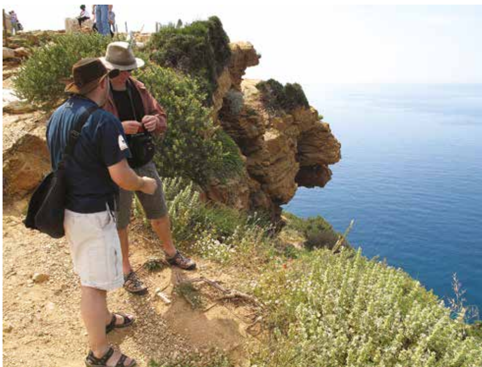
Naturvägledning är ofta ett inslag i ekoturism.

som de som beskrivits för environmental education. Men inom ekoturismforskning ses naturvägledarrollen som mer central. Det ligger i naturvägledarens ansvar att förstärka aktivitetens tema och huvudpoänger, presentera information i logisk följd, uppmuntra deltagare att använda flera sinnen, använda berättelser, involvera deltagarna genom att ställa frågor, samtala med deltagare innan turen, se till att deltagarna får tillgång till rekvisita och olika aktiviteter, förhöja interpretationen genom att använda gester, använda modeller och diagram och inleda med provocerande påståenden (se Ballantyne & Hughes, 2001; Ham & Weiler, 2002; Lindsay, 2003).