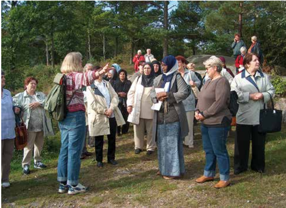
Naturvägledaren behöver ha god kännedom om sin målgrupp.