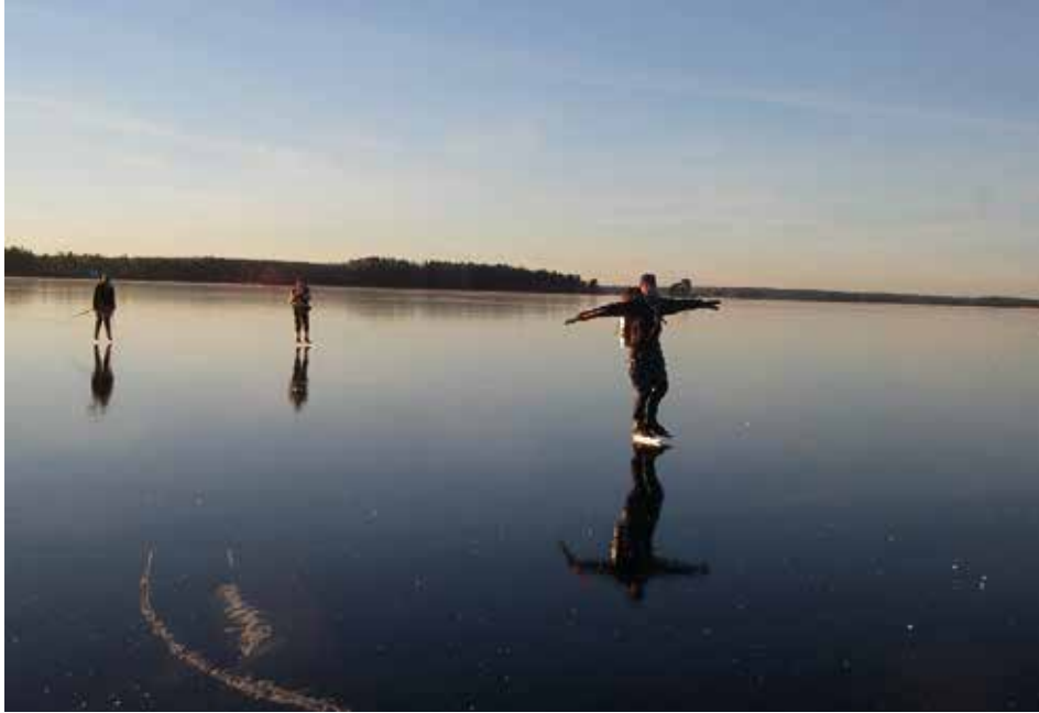
Friluftsliv vintertid.