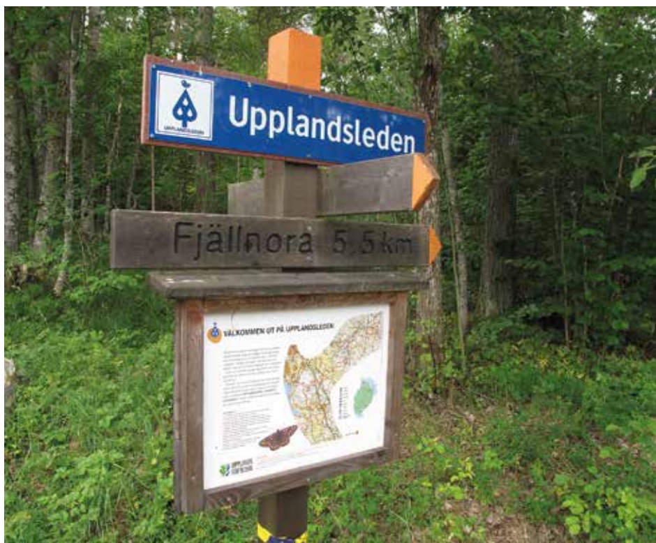
Obemannad naturvägledning kan till exempel vara skyltning och information på plats om ett naturområde.

Syftet var att i första hand fokusera på den typ bemannad och obemannad naturvägledning som sker på plats (t ex naturguidning, natur- och kulturstigar, skyltning) eller i nära anslutning till ett natur- eller kulturlandskap (t ex naturum, ekomuseer 2 , utställningar), med uttalat syfte att berätta om sambanden mellan människa och natur. Här har jag alltså försökt att göra en avgränsning och endast undantagsvis inkluderat naturvägledning via böcker & skrifter, film, webb m fl medier.