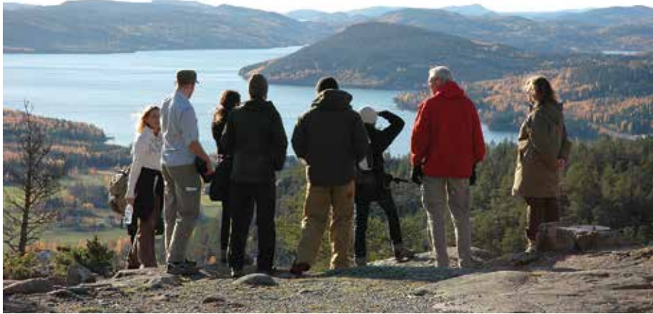
Nature interpretation contributes to constructing our nature experience.

to research would strengthen their quality. However, nature interpretation is not a research discipline, but rather a topic that requires research from various perspectives. That interdisciplinary context could be treated by different branches – from public health science, to cultural studies, to forest sciences, if it is combined with communication science, pedagogics or similar fields. Environmental psychology, marketing and media sciences could also provide knowledge about behavioural impacts that nature interpretation often aims for in a general context.