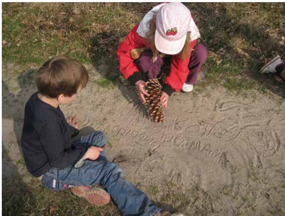
Utomhuspedagogik.