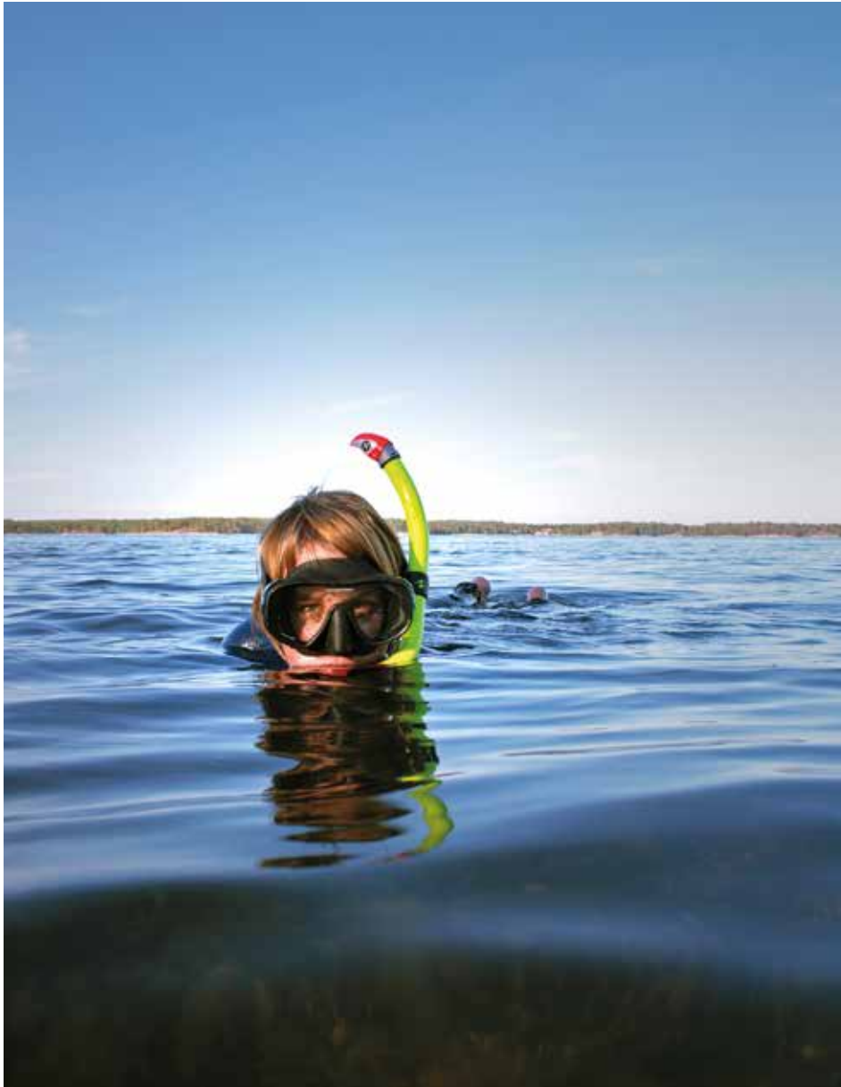
Naturvägledning är en lärandesituation där var och en gör sina egna erfarenheter.

och förbättras. Kohl föreslår fyra olika strategier för att integrera naturvård och naturvägledning: