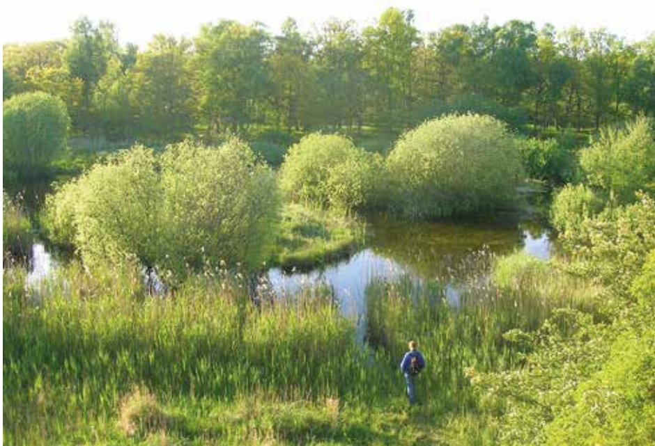
Kan sinnesintryck och känsloupplevelser i naturen förändra människor?

en sådan avgörande naturupplevelse. Ballantyne et al. (2011a) har undersökt naturturisters minnen av en naturvägledningssituation fyra månader senare. De har undersökt minnen av sinnesintryck, samt de känsloupplevelser, tankar och beteenderespons som naturvägledningssituationen innebar och ledde till. Detta resultat menar de kan användas av naturvägledare för att både ge nöjdare deltagare och gynna långsiktiga beteendeförändringar i miljövänlig riktning.