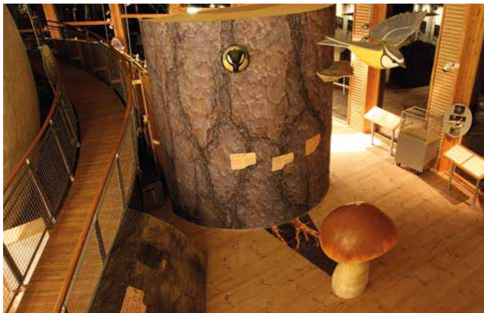
När naturvägledning sker inomhus blir det särskilt uppenbart att "naturmötet" är iscensatt.

Quistgaard & Ingemann (2010) har studerat ungdomar som besöker danska naturvetenskapliga utställningar. De har sett att besökarna behöver stöd för att själva kunna skapa mening utifrån vad de upplever. En guide eller en lärare som aktivt använder dialog hjälper besökaren att själva ställa frågor och rikta sin nyfikenhet mot utställningen. På så sätt uppmuntras egna reflektioner som skapar mening. Särskilt viktigt med dialog är det om miljön upplevs som exkluderande, skriver Quistgaard & Ingemann (2010). Här ser jag en direkt koppling till naturvägledarens roll i en naturvägledningssituation.