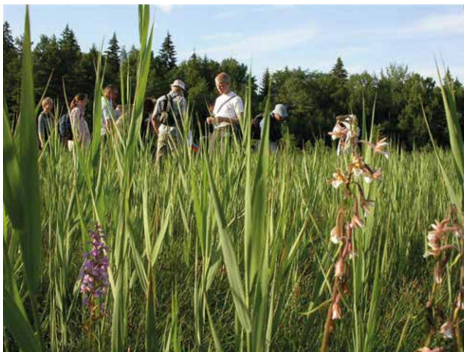
Naturvägledning är ett sätt att informera allmänheten om biologiska värden i ett naturreservat. Foto: Jan Olof Svensson.

Som jag beskrivit i tidigare avsnitt om internationell forskning är naturvägledning på många håll i världen relaterad till naturvård och naturförvaltning. I inledningen av avsnittet om naturvägledning i Sverige visade jag att kopplingen till naturvård och skyddade områden är stark även här. Därför kan det vara relevant att titta på forskning som rör naturvårdens sociala dimensioner. Det handlar t ex om planering för friluftsliv, människors relation till skyddad natur, och urban naturvård (Emmelin et al. , 2005; Stenseke, 2010; Borgström, 2011; Henningsson, 2008). Dock behandlar inte dessa studier naturvägledning explicit.