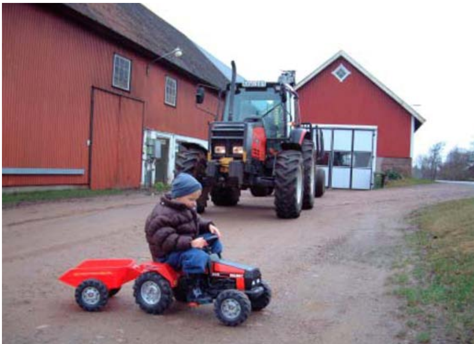
Figur 2. Under 2011 dog 3 barn i lantbruket – traktorer var inblandade i samtliga fall.