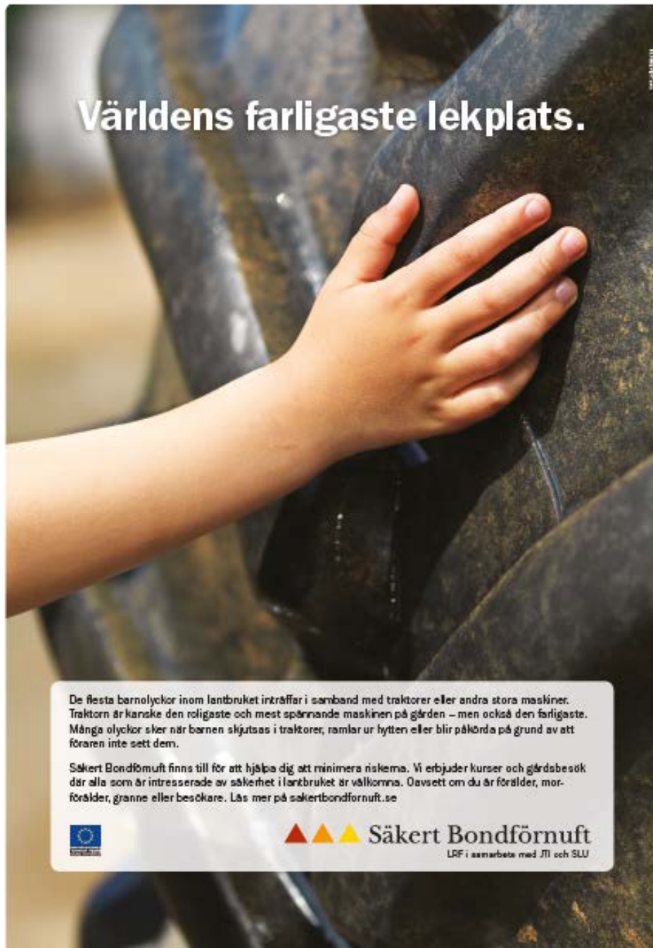
Figur 1. Kampanjannons för ”Säkert Bondförnuft”.

”Sveriges farligaste lekplats” har Säkert Bondförnuft haft som rubrik på helsidesannonser i Lantbrukspressen (figur 1).