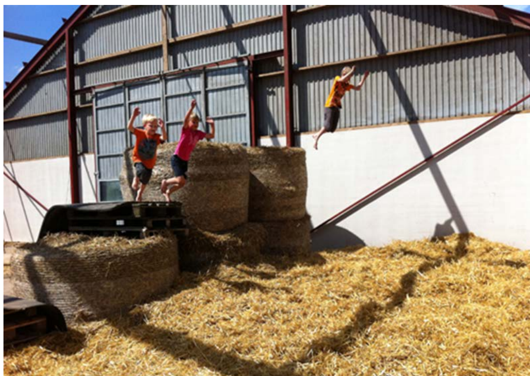
Figur 7. Foto på Skånemejeriers hemsida. ”Stort tack till alla som besökte årets Öppen gård”.

Leka i höstackar, bland halm och halmbalar är en del av den positiva bild som förmedlas av lantbruket som en idyllisk och härlig uppväxtmiljö. Det har varit så under lång tid och även idag finner vi denna bild av lantbruksmiljön. Skånemejerier bjöd t ex in allmänheten till Öppen Gård och lägger ut bilder på barn som leker bland storbalar, figur 7.