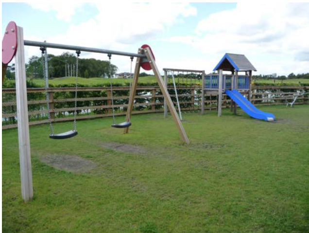
Figur 6. Barriärer är en viktig strategi för mindre barns säkerhet.

Barn i 4-5 årsåldern är nyfikna och mycket rörliga. Tillsyn och barriärer är fortfarande viktigt. Fokuserad uppmärksamhet (utan att t ex läsa eller prata i mobiltelefon) är viktigt så att vuxna aktivt kan ingripa om barnen kommer nära riskfyllda situationer eller faror. När barn närmar sig skolåldern kan föräldrar börja med att lära barnen enkla regler för att undvika faror.