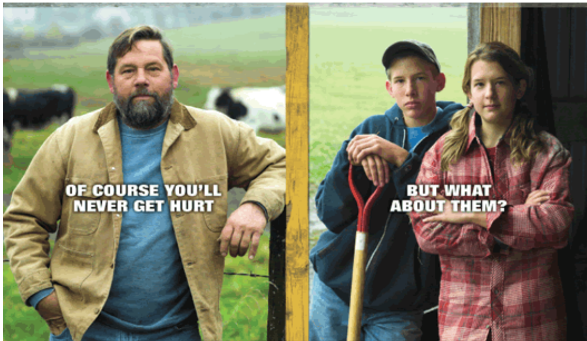
Figur 3. Forskning från USA har visat att lantbrukare är mer motiverade att diskutera säkerhetsfrågor som gäller sina barn eller anställda än vad man är när det gäller dem själva. Källa: Sorensen, J.2009.