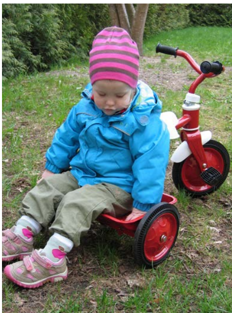
Figur 11. Hur ska min barntillsyn ordnas? Ska jag vara på förskola – eller med pappa när han jobbar i traktorn, stallet och verkstaden?