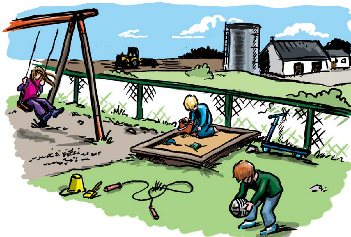
Figur 13. Yngre barn bör ha tillgång till en säker och attraktiv lekmiljö. Illustration: Fredrik Saarkoppel.