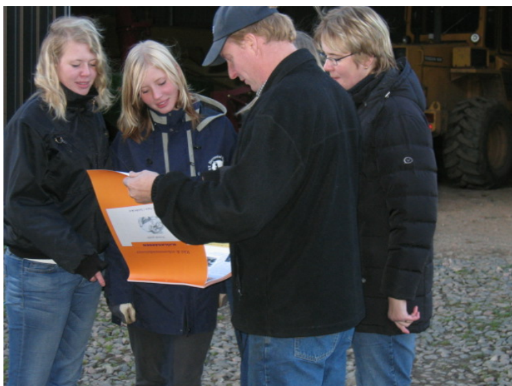
Figur 14. En familj diskuterar en provversion av rekommendationer gällande barn- & ungdomars medverkan i arbetet på en hästgård.

http://pub.epsilon.slu.se/8027/1/alwall_svennefelt_et_al_110404.pdf