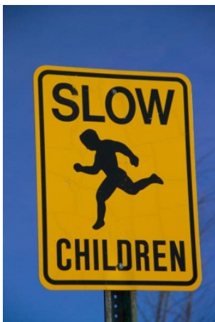
Figur 9. Är det varning för lekande barn – eller arbetande barn på din gård?

Vilka budskap sänder media och hur påverkar detta attityden till risker för barn i lantbruksmiljön? Varför rapporteras bara skadehändelser och inget om hur skadan kan förebyggas?