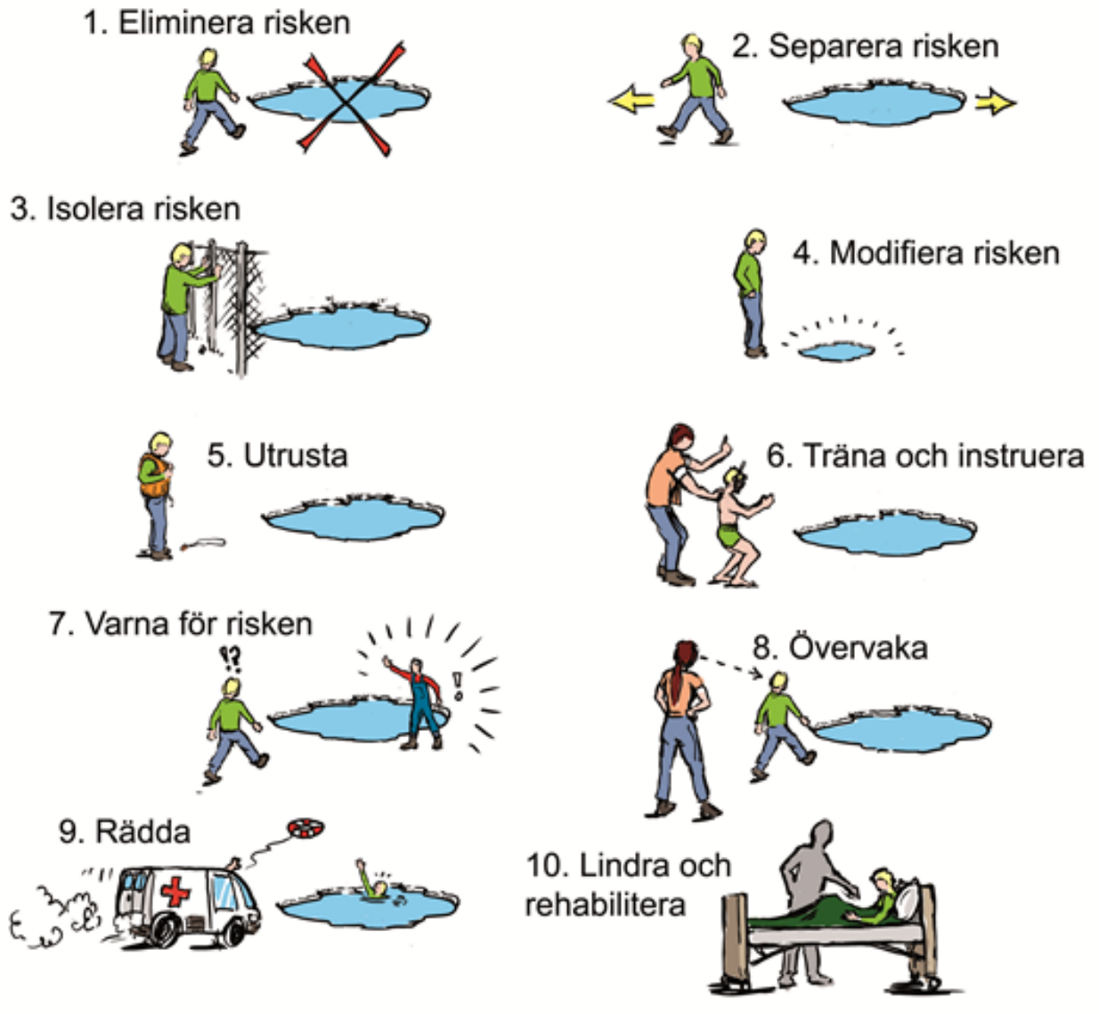
Figur 10. Principer för åtgärda och förebygga skaderisker – exempel med barn och en damm. Källa: Haddon, 1980. Illustration: Fredrik Saarkoppel.

10. Lindra och rehabilitera – om det som inte får hända ändå händer och det sker en skada gäller det att det finns det stöd som behövs för att läka och återhämta sig.