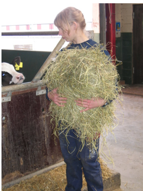
Figur 5. Barn ska inte ha arbetsuppgifter som medför skaderisker.

Arbetsmiljöverket är myndigheten vad gäller arbetsförhållanden och arbetsmiljölagstiftning i Sverige och minderårigas arbetsvillkor finns reglerat i föreskriften ”Minderårigas arbetsmiljö” och en speciell handledning har även utarbetats (Arbetsmiljöverket, 2012a,b). Syftet med föreskrifterna är att förebygga att den som inte fyllt 18 år genom sin arbetsmiljö drabbas av ohälsa och olycksfall eller får sämre förutsättningar att utvecklas eller tillgodogöra sig utbildning. Se vidare i referenslista med länkar.