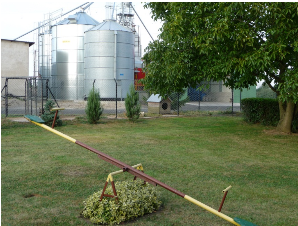
Figur 12. Vinnare av årets bästa arbetsplats 2010 inom jordbruket i Polen har ett stängsel med grind mellan arbetsplatsen och bostaden.

Finns det lantbrukare i Sverige som ”vågar ta steget” att fysiskt dela gården i en bostadsdel och en arbetsplats?