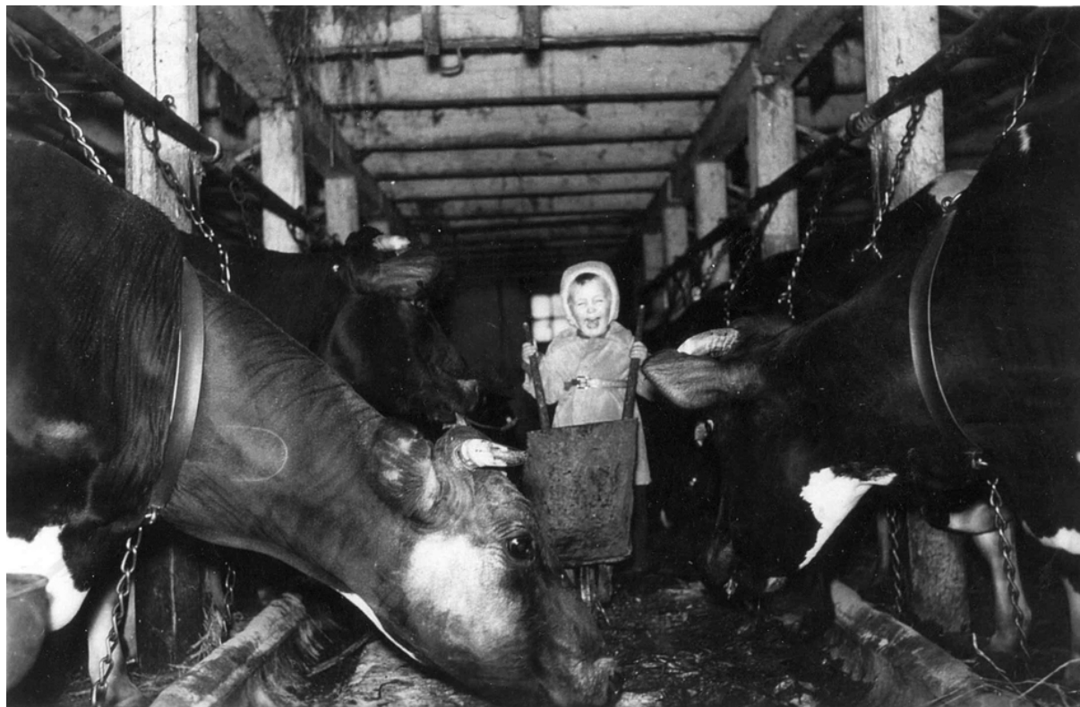
Figur 4. Barn på landet har i alla tider varit med föräldrarna i arbetet – roligt men farligt!

För att ta del av den fullständiga rapporten om barn – och ungdomars medverkan i lantbruksarbete: http://pub.epsilon.slu.se/8027/1/alwall_svennefelt_et_al_110404.pdf Läs också mer om de konkreta råden på sidan 37: