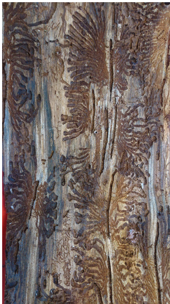
Figur 1 Bilden visar ett barkprov med gångsystem av granbarkborre

Barkprov insamlat från en gran dödad av granbarkborre. Barkproven tas på 4 meters höjd och analyseras sedan med avseende på granbarkborrens angreppstäthet och förökningsframgång samt förekomst av fiender och konkurrenter till granbarkborren. De horisontella gångarna är modergångarna längs vars sidor honorna lägger sina ägg. Ur äggen kläcks larver som gnager ut var sin larvgång.