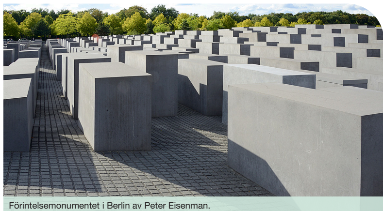
Förintelsemonumentet i Berlin av Peter Eisenman.