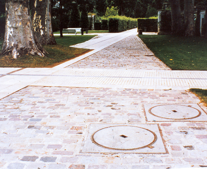
I Parc de Bercy, Paris, är tre tidslager avläsbara.