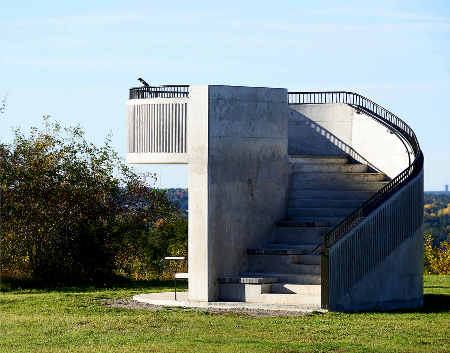
Fågelskådartorn på Vårbergstoppen. Härifrån kan besökaren inte bara skåda fåglar utan också blicka ut över Stockholm med omnejd. Arkitekt: Andrén Fogelström