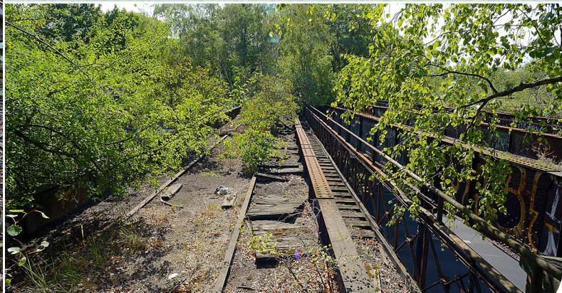
Järnvägsviadukt i Park am Gleisdreieck.