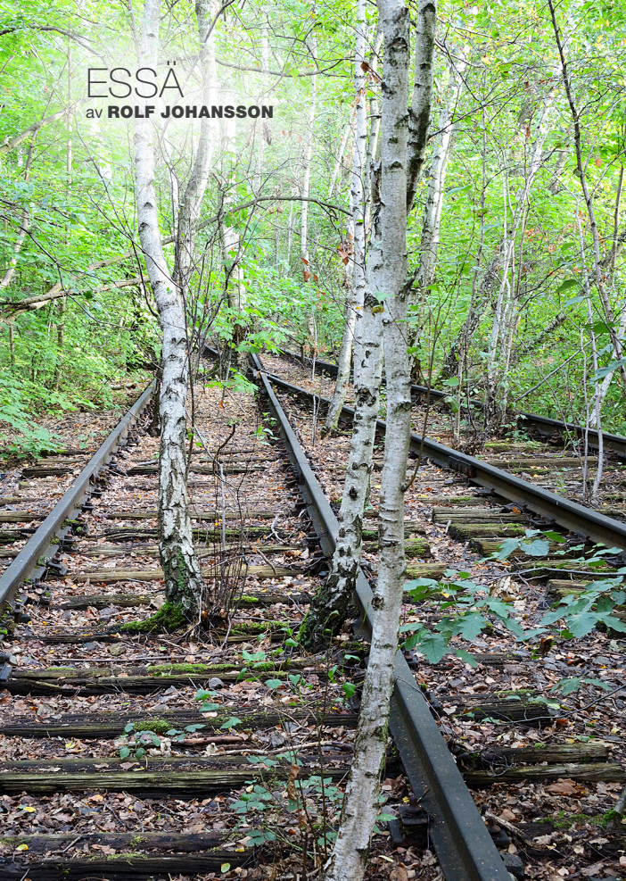
Naturens revansch i Natur-Park Schöneberger Südgelände, Berlin.