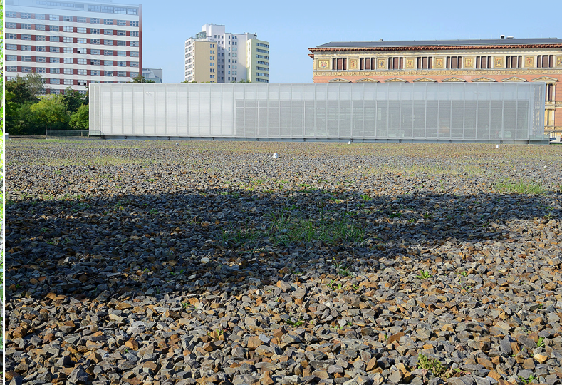
Topographie des Terrors. Terrorns geografiska centrum. Platsen som inte kan förskönas.