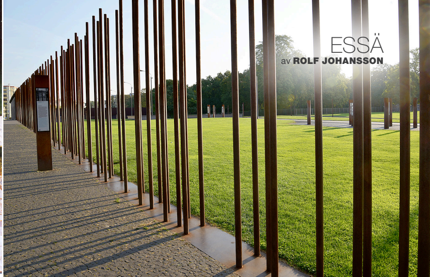
Gedänkstätte Berliner Mauer, ett minnesmärke över människoöden vid muren.