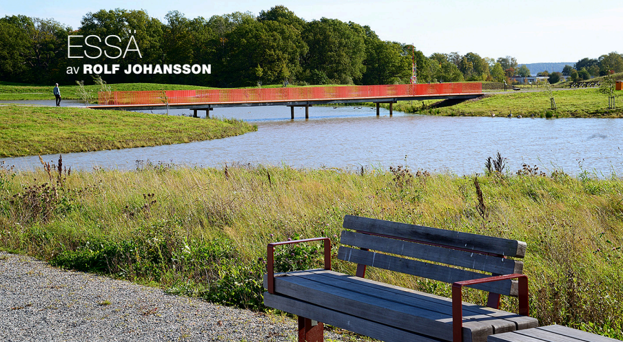
Johannisbergs våtmarkspark i Västerås. Sedimentdamm som utgör sista steget i reningen av dagvattnet innan det släpps ut i Mälaren, som kan anas borta vid horisonten. Arkitekt: Topia Landskapsarkitekter.