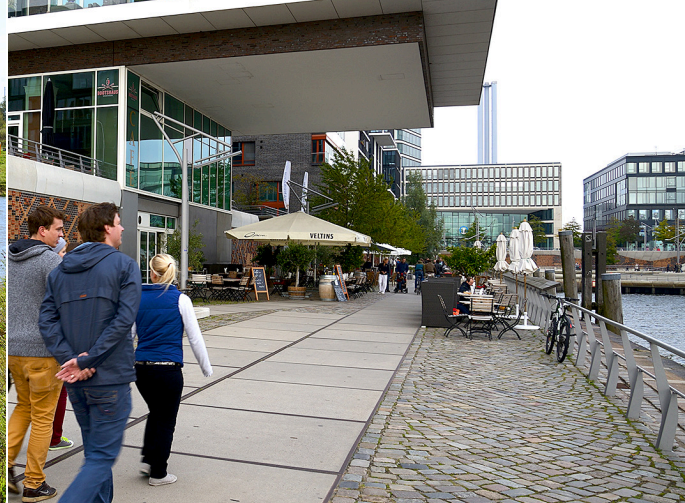
Hamburg Hafen City. En gångväg tre meter över lågvattenståndet där promenaden ger kontakt med vattnet. Inbland svämmas den över. Cafét längre fram har vattentäta dörrar att stänga till när vattnet stiger och gångvägen tillfälligt stängs.